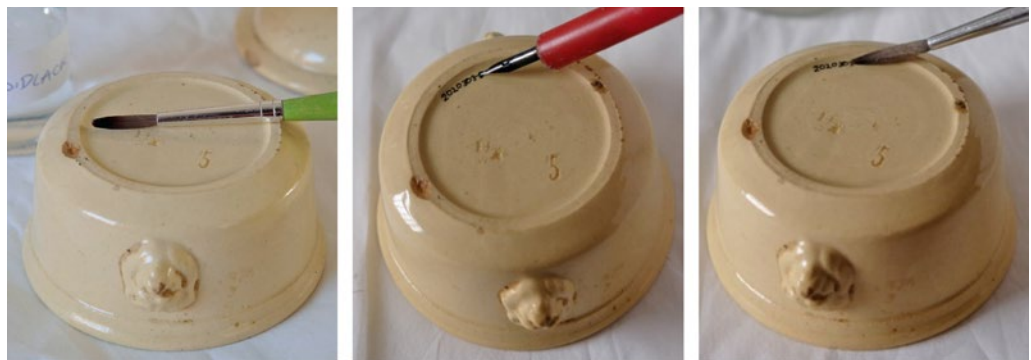
Abbildung 1: Aufbringen einer Inventarnummer